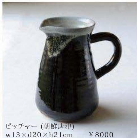
ピッチャー (朝鮮唐津) w13×d20×h21cm ¥8000

歴史と伝統のある焼き物の産地、唐津。そこで作られている『唐津焼』にはどんなイメージをお持ちでしょうか。