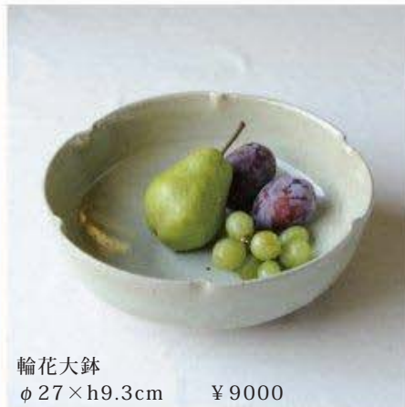
輪花大鉢 φ27×h9.3cm ¥9000