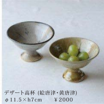
デザート高杯 (絵唐津・黄唐津) φ11.5×h7cm ¥2000