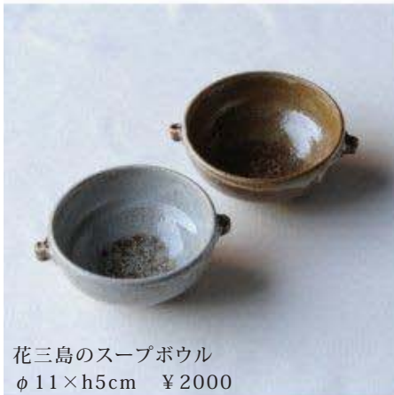
花三島のスープボウル φ11×h5cm ¥2000