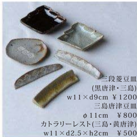
三段菱豆皿 (黒唐津・三島) w11×d9cm ¥1200 三島唐津豆皿 φ11cm ¥800 カトラリーレスト(三島・黄唐津) w11×d2.5×h2cm ¥500