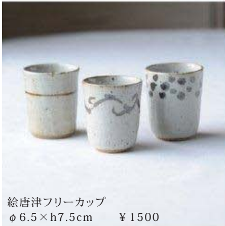
絵唐津フリーカップ φ6.5×h7.5cm ¥1500