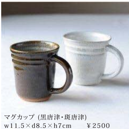
マグカップ (黒唐津・斑唐津) w11.5×d8.5×h7cm ¥2500